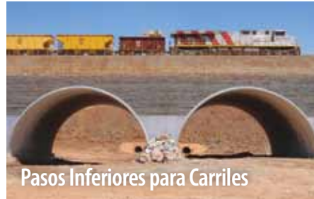
Pasos Inferiores para Carriles

Con su peso ligero y fuerza superior, nuestro acero de corrugado profundo Super-Cor® es ampliamente usado para estructuras grandes de ingeniería. Por lo general nuestro producto Bolt-A-Plate® es indicado para estructuras de tamaño mediano.