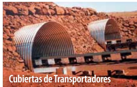
Cubiertas de Transportadores

Ofrecemos una gama completa de Tubos de Acero Corrugado ya sean galvanizados, aluminizados o laminados de polímero para requerimientos de drenaje y ventilación.