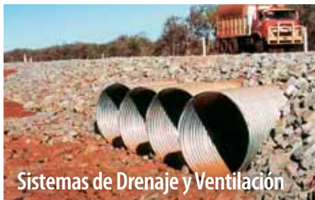
Sistemas de Drenaje y Ventilación

De manera rápida y sencilla, nuestros Puentes de Acero Modular vienen en una variedad de anchos y tramos para tratar con vehículos de minería pesada. Nuestros Sistemas de Muro Estructural TEM o Bolt-A-Bin® crean contrafuertes y muros de costo efectivo en el lugar.