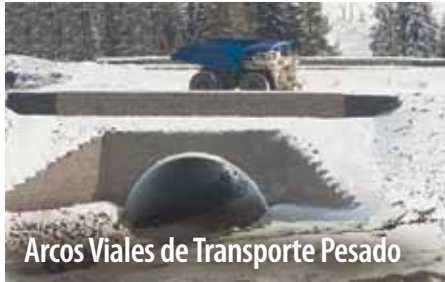
Arcos Viales de Transporte Pesado

Cualesquiera que sean sus necesidades, nuestros equipos de ingeniería internos proveerán soluciones que se transportan económicamente a sitios remotos y que se ensamblan rápidamente con requerimientos mínimos de equipo, material y mano de obra.