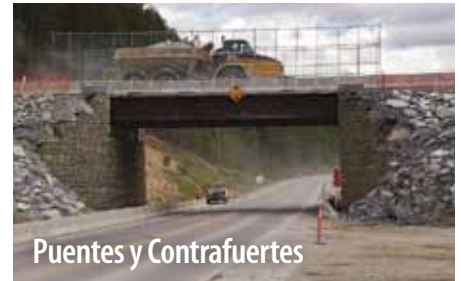
Puentes y Contrafuertes

Para soluciones de peso ligero, fuertes y fáciles de instalar, elija Super-Cor® o Bolt-A-Plate® de servicio pesado para aplicaciones de túneles grandes o medianas.