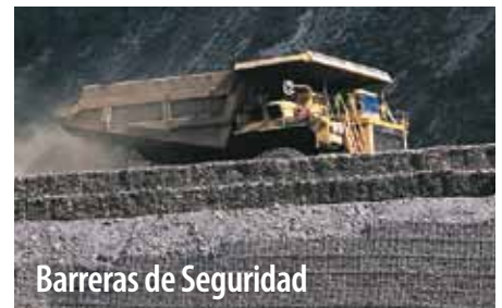
Barreras de Seguridad

Según el tamaño y especificación requeridos, las cubiertas de transportador pueden ser hechas de distintos perfiles de formas en Bolt-A-Plate® o Tubo de Acero Corrugado.