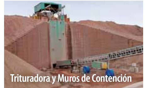
Trituradora y Muros de Contención

Dependiendo del tamaño, especificaciones y factores de carga, se indica el uso de Super-Cor® o Bolt-A-Plate®. De cualquier manera, nos especializamos en trabajar con sus equipos para limitar o eliminar interrupciones críticas de tráfico e impactos al sitio.